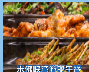
米佛峡湾游船午餐